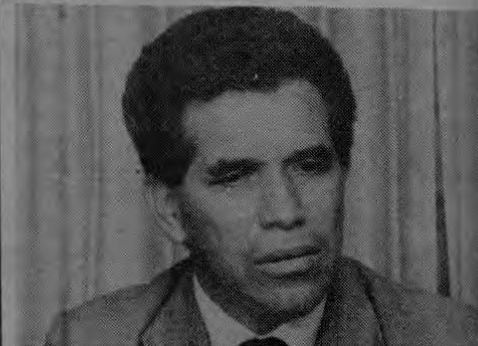
El Ministro de Trabajo, Carlos Monge, anunció ayer la iniciativa centroamericana para armonizar las políticas laborales y de seguridad social en la región, y señaló que ya elevó la propuesta al Presidente de la República, Lic. Rafael Ángel Calderón.

En general, concluyó el Lic. Monge Rodríguez, el objetivo de la integración es que la fuerza laboral centroamericana, como bloque, sea competitiva en el mercado productivo mundial y sirva de arma para combatir la pobreza.