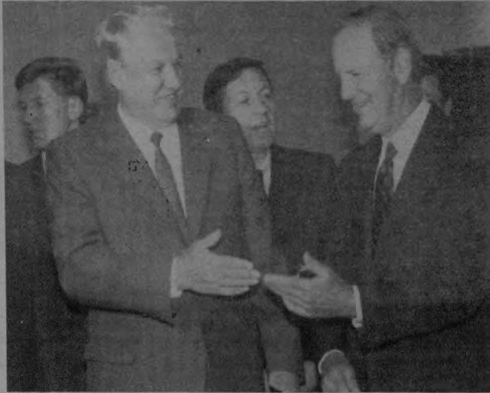
MOSCU — El presidente de la Federación Rusa, Boris Yeltsin conversa animadamente con el secretario de Estado norteamericano, James Baker, después de una conferencia de prensa.

Creo que ahora podremos hablar de la adopción por el Gobierno norteamericano de medidas recíprocas para crear una situación normalizada, expresó Pankin.