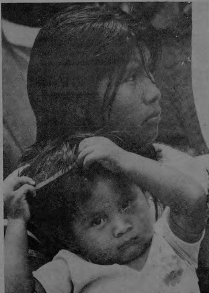
Aunque no es determinante para los efectos de la cedulaación, el uso particular que los indígenas dan a sus nombres y apellidos, de alguna manera hace más lento su proceso de cedulaación. (A. Marín)

El problema es mayor cuanto más adulta es la población y adquiere características especiales