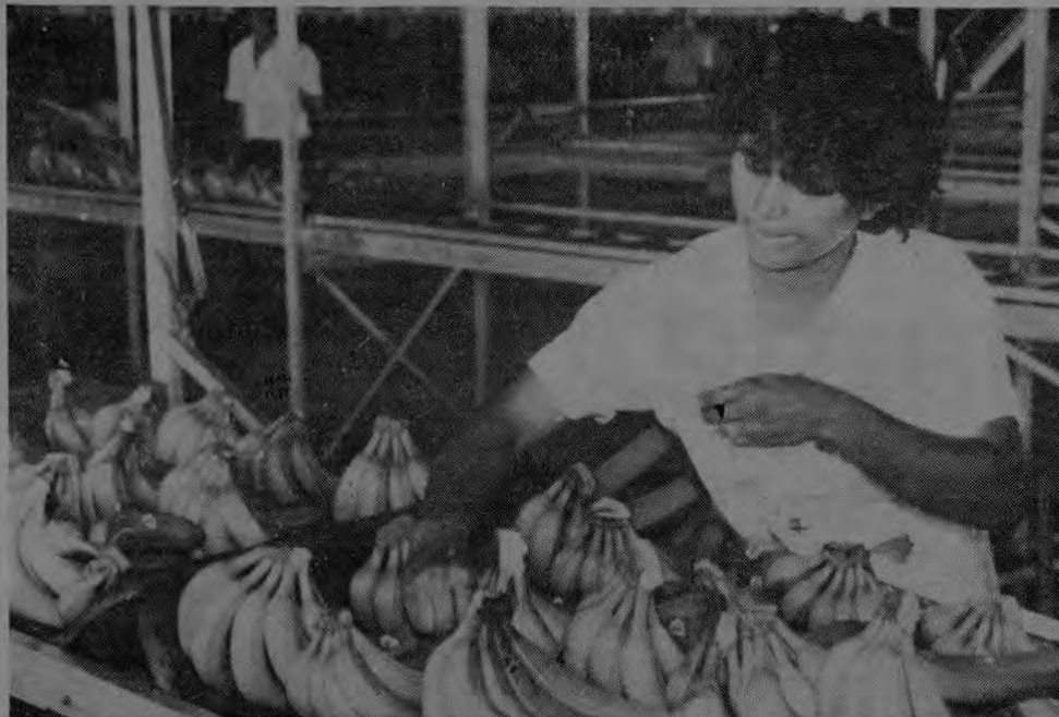
La zona sur será reactivada con la siembra de 5.000 hectáreas de banano en Palmar y Río Claro.

hectáreas de palma africana para la elaboración de aceite, y se reparó el canal de riego de Palmar, con la participación del Servicio Nacional de Aguas Subterráneas, Riego y Avenamiento (SENARA) a un costo de 45 millones de colones. Con el riego se habilitarían unas 60.000 hectáreas. Eventualmente, la piña de Buenos Aires y productos como papaya, po-