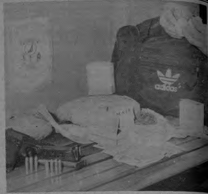
El OIJ decomisó ayer dos kilos de cocaína, cerca de ¢154 mil y un revólver, durante un operativo en el que se desarticuló una banda distribuidora de droga. (M. Monge)

Sobre el trabajo con la familia, dijo que el futuro Instituto de la Familia será el encargado de bregar con las situaciones que afectan al núcleo familiar costarricense.